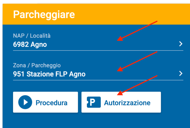
Selezione della località e accesso alla sezione Autorizzazione